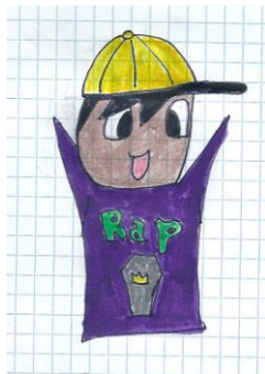
ciao sono Angelo