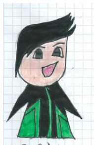
ciao sono Skandar