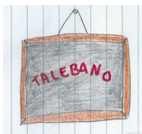
ciao sono Ghattas